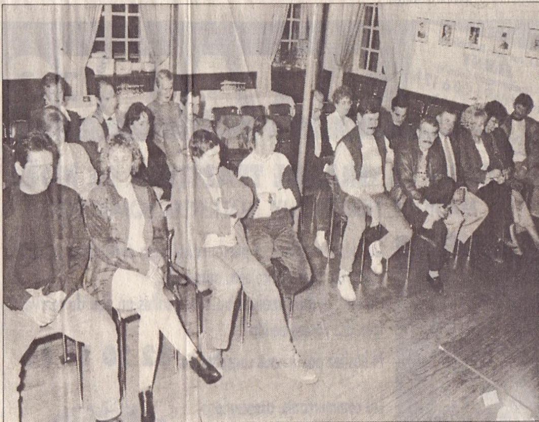
Une assemblée générale qui a permis d'accepter l'adhésion de quatre nouveaux membres.

Ce qui a permis la poursuite de fructueux échanges et contacts après l'assemblée générale.