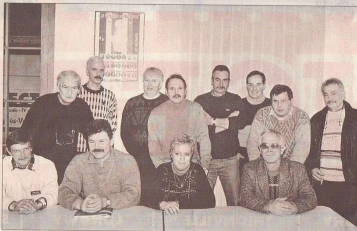
Groupelor honore un bail de quinze années à l'occasion de son assemblée générale tenue en mairie de Hatrize.

Les communes font confiance de plus en plus à l'association : Lubey, Les Baroches, Briey, Lantéfontaine, Mancieulles... et les particuliers font appel au travail sérieux, et de qualité de ce groupement d'artisans. Les prestations de Groupelor dans les collectivités lo-